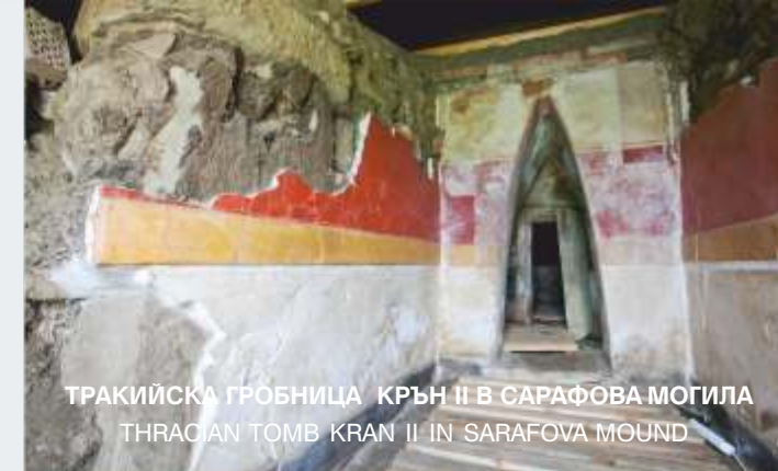
ТРАКИЙСКА ГРОБНИЦА КРЪН II В САРАФОВА МОГИЛА THRACIAN TOMB KRAN II IN SARAFOVA MOUND

Тракийската гробница Крън 2 се състои от коридор и две правоъгълни помещения. Стените им са покрити с шукатура с нанесени хоризонтални пояси в бяло, черно, червено, оранжево и жълто. По план, материали и строителна техника тя е най-близка по дизайн до Казанлъшката тракийска гробница.