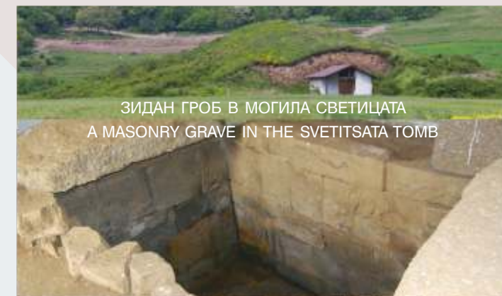
ЗИДАН ГРОБ В МОГИЛА СВЕТИЦАТА A MASONRY GRAVE IN THE SVETITSATA TOMB

A tomb was discovered in the Goliama Arsenalka mound which consists of a facade, rectangular antechamber and dome burial chamber. The entrances to the chambers had two-leaved folding stone doors. The dome of the burial chamber is complete with a horizontal keystone and there is a bed opposite the chamber entrance.