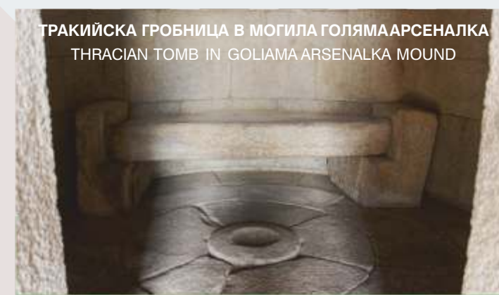
ТРАКИЙСКА ГРОБНИЦА В МОГИЛА ГОЛЯМААРСЕНАЛКА THRACIAN TOMB IN GOLIYAMA ARSENALKA MOUND

The Thracian tomb Kran II consists of a passage and two rectangular chambers. The walls are covered with stucco applied with horizontal bands in black, white, red, orange and yellow. The plan, materials and the construction design resemble the Kazanlak Thracian tomb.